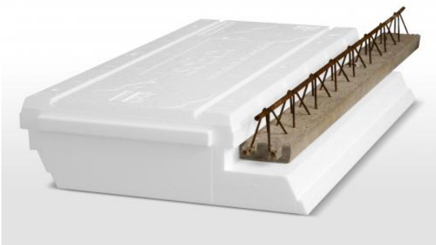
Hourdibox PT M4